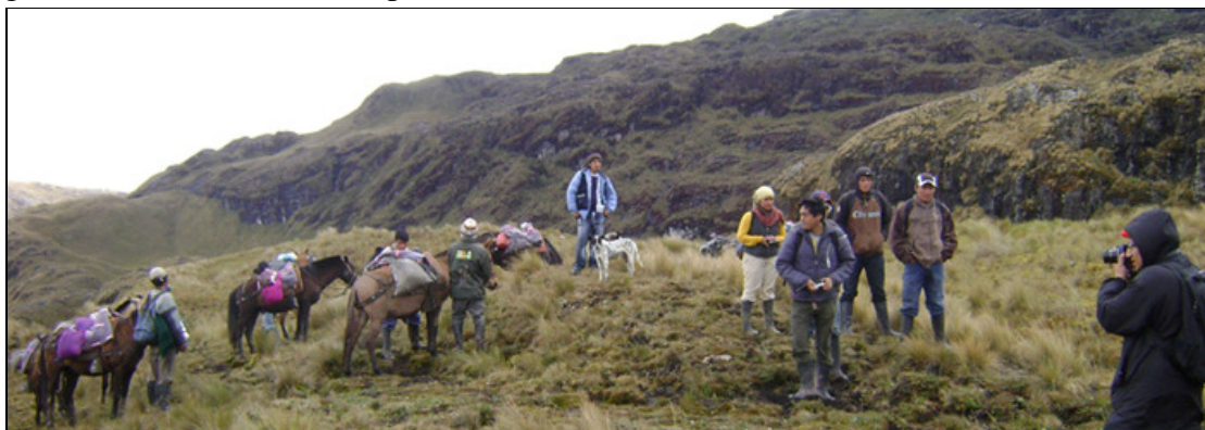
El camino al Breo.

En Septiembre, Sam Shanee de NPC lideró un equipo de biólogos de la Universidad Nacional Mayor de San Marcos, Universidad de Trujillo, y de la ONG Amazónicos por la Amazonía (AMPA) en una expedición a las montañas para llevar a cabo el primer inventario biológico desde la creación de la nueva concesión para la conservación “El Breo”. El área de investigación se ubicaba en un lugar tan remoto que tomó cuatro días de dura caminata sobre terreno accidentado y bosque profundo para llegar! La información recopilada está aun siendo analizada, sin embargo muchas especies interesantes han sido encontradas y existe la posibilidad que algunas de estas sean nuevas para la ciencia.